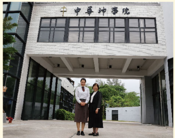
往泰北短宣同學與師長