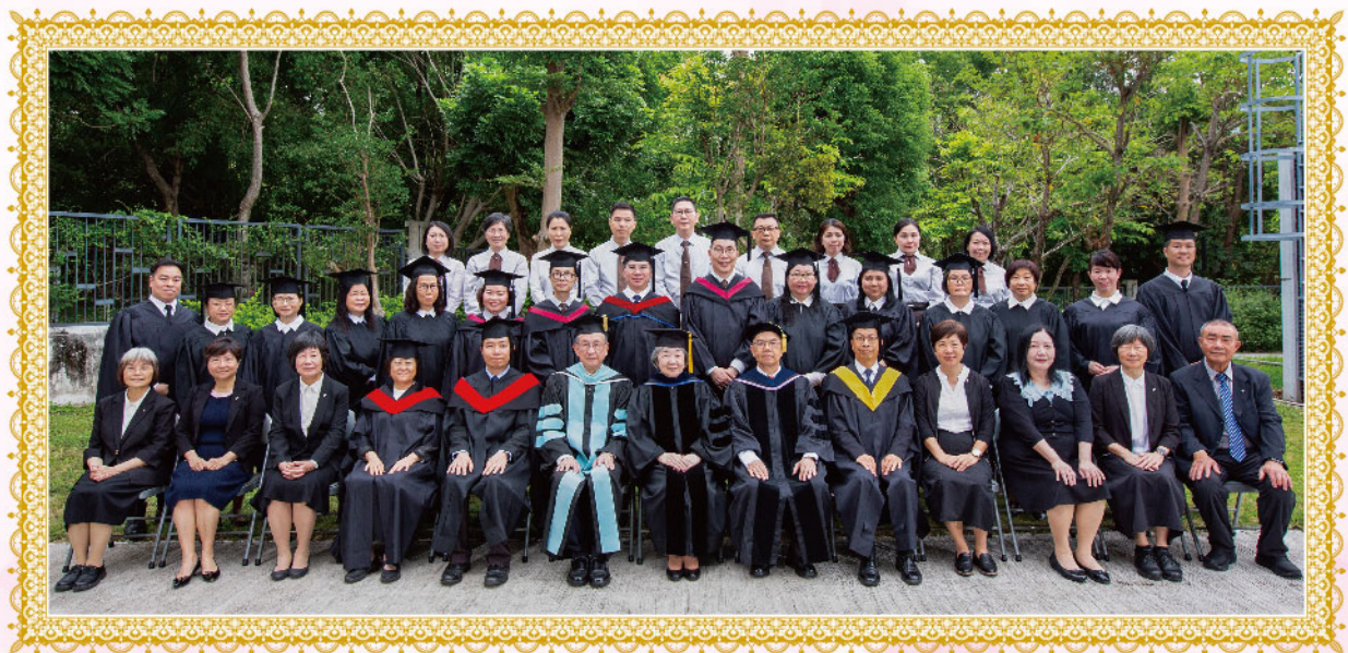
畢業生與師長及同工合照