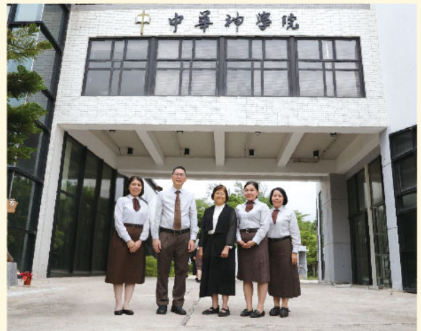
L國短宣同學與師長