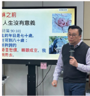
同學分享得救見證

我們看見很多長者都願意投入參與整個活動裏面，尤其在詩歌和遊戲的環節，他們都積極參與，也主動舉手答問題。當同學在分享見證時，長者也專心聆聽，非常投入，實在非常感恩！