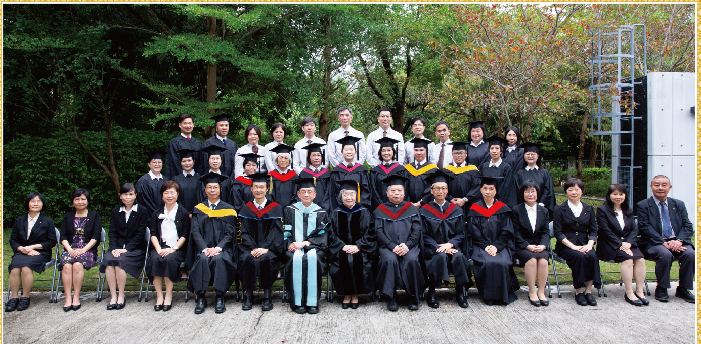
畢業生與師生同工合照