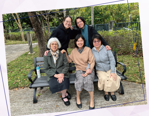
筆者(後排右)與畢業班同學合照