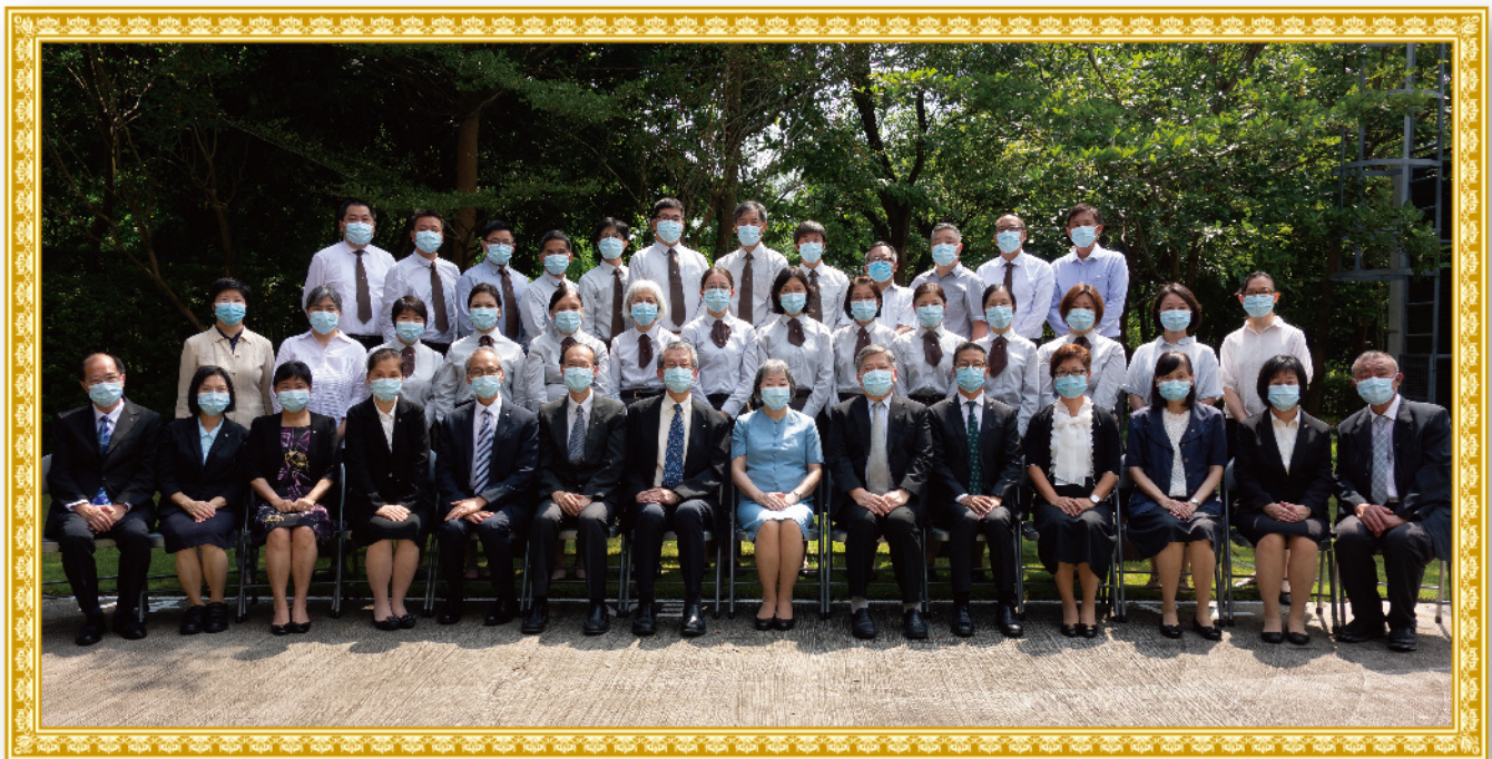
2022-23 年度師、生、同工合照