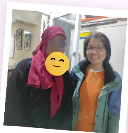
筆者與 S 語老師合影

第二天早上，這學生走來請我們吃飯，我跟大家拍了張團體照，順道也把相片傳給他，他很高興收到相片，並回覆：「謝謝，姊妹。」，即是代表他接納我為好朋友。這是聖靈的工作。願我們時常為 S 民禱告守望，倚靠主大能作工。