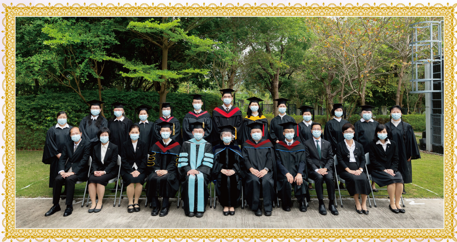
畢業生與師長、同工合照