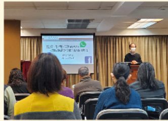
1 月 17 日公開講座

WhatsApp 即時通訊對牧者的影響和應用」。當日共有 46 人出席。會後答問時間，參加者皆踴躍交流，大家獲益良多，感恩！