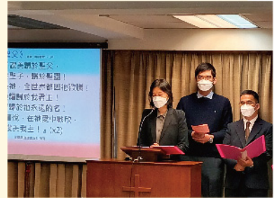
1 月 31 日年終感恩崇拜