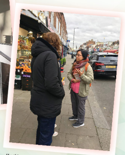
作者（右一）於北倫敦街頭傳福音