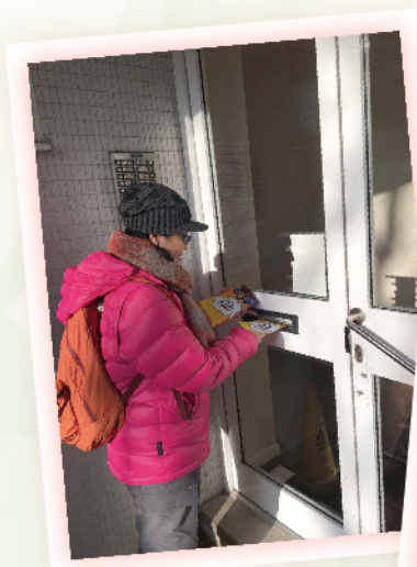
作者於北倫敦逐戶佈道

現在雖身處宣教工場中，自己既是宣教新丁一名，邊學邊做。請大家祈禱記念我在倫敦向猶太人宣教的事奉，盼望有更多猶太人早日認識耶穌是彌賽亞！