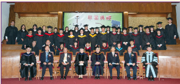
主禮團與畢業生合照