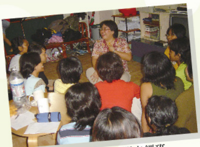
作者與印尼姐姐開查經班

「我們是泥，你是窯匠，我們都是你手的工作(賽64:8)。」當我願意在事奉的路上任憑主用的時候，我看見了神的計劃，你是否也願意離開已熟悉的安舒區去看見神更大的藍圖？