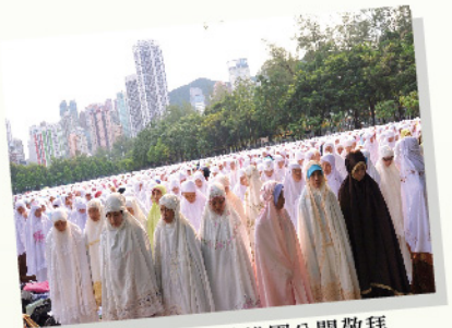
印尼姐姐在香港維園公開敬拜