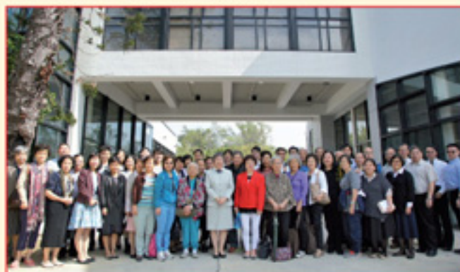
純恩堂迦南團契與本院師生合照