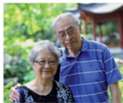
作者黃錫培先生伉儷 本院北美董事會董事