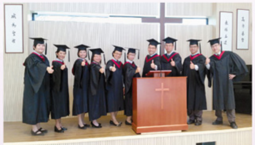
作者（左六）與同班畢業生合照