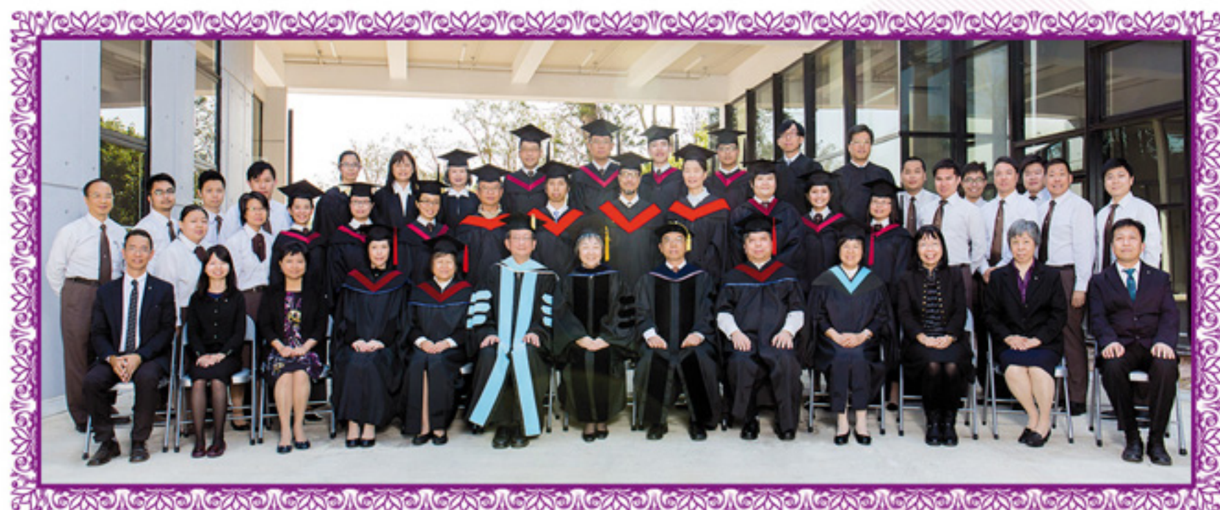
畢業生與師長、同學和同工合照

願每一位準畢業生在參加畢業禮前，再次在那位呼召自己的神面前鄭重地省思：感謝祂對自己無條件的呼召，感謝祂為自己開了裝備之門，感謝祂藉家人和教會去扶持，感謝祂多方面的供應，感謝祂忍耐地導引自己成長……存着一顆敬畏的心，與主立約，一生一世，委身愛神愛人，將生命全然擺上，致力作一個無虧的神僕。願你們在這次的畢業禮中，每一位都可以坦然地向主說：「我在這裡，請差遣我！」。