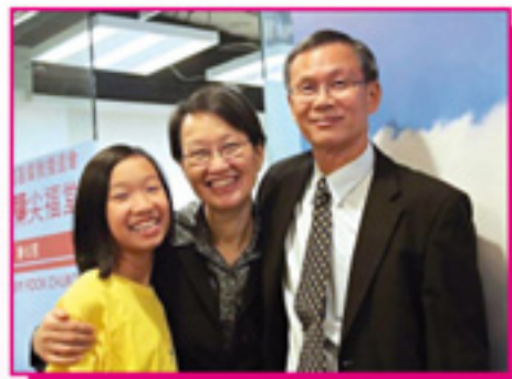
作者（左二）與家人合照

裝備的過程，無論是必修科或選修科的學習，都讓我眼界擴闊了，對聖經的認識進深了，對聖靈在歷史中的工作體會深刻了，發現神使我的生命更新了，而且是持續不斷的。雖然，學習的課程有完成的一天，畢業的時候，但生命的更新成長，卻是沒有完結的時刻。願帶著神給我過去生命的建立，繼續經歷祂恩慈的手陶造，生命能挖得更深更闊，盛載祂從上而來的豐盛（約 10:10）。榮耀頌讚都歸給我主！